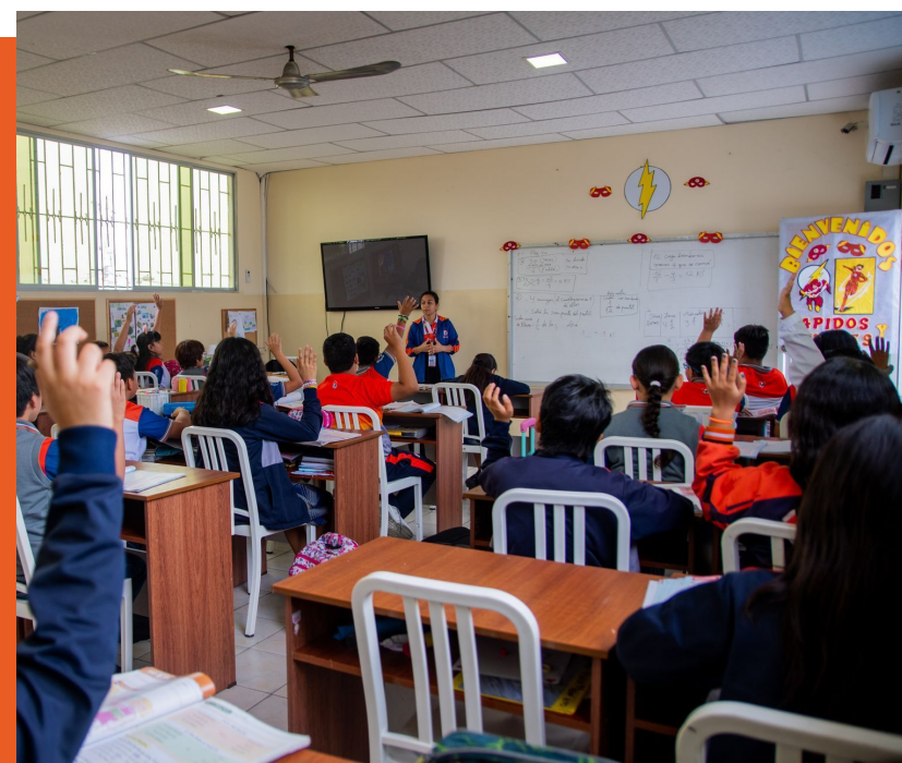
AULAS CON AUDIOVISUALES